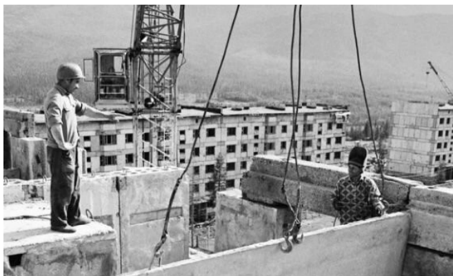
Строительство нового бесплатного жилья в СССР велось ударными темпами