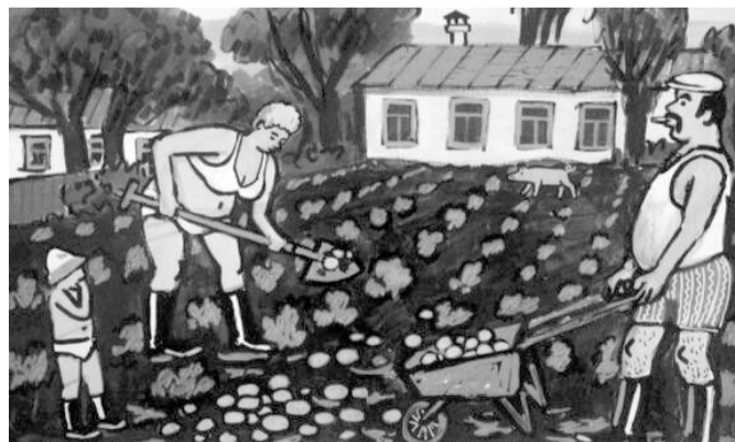
И об этом мало кто знает - у большинства советских рабочих были и свои загородные дачи

Ну, об этом я напишу в другой своей публикации, и очень многие мои читатели очень сильно удивятся.