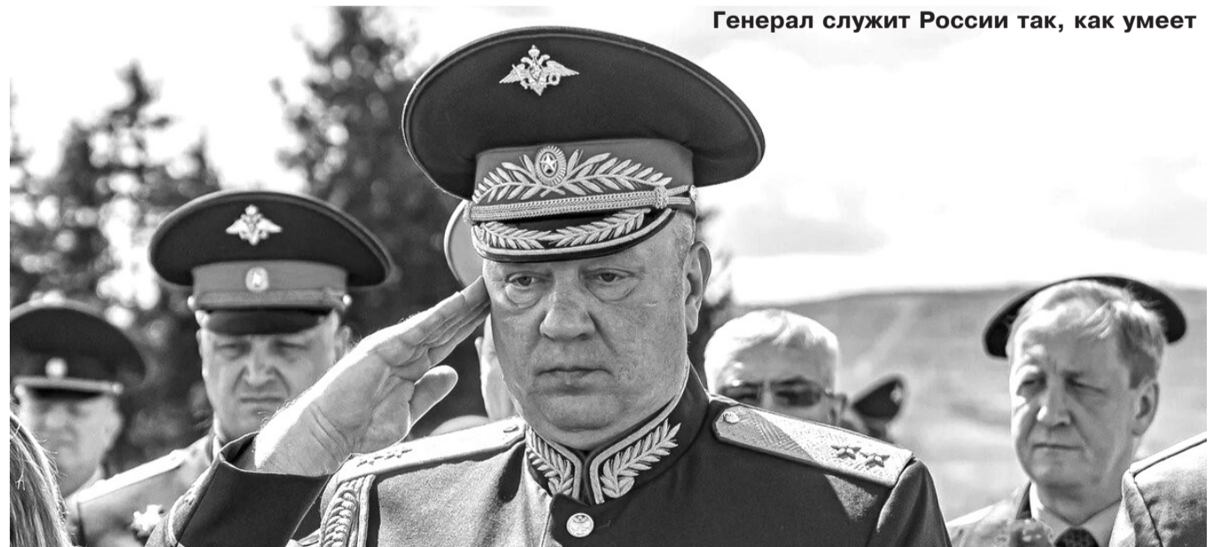
Генерал служит России так, как умеет

И возмутило генерала не то, что пропало полтора миллиона комплектов обмундирования для мобилизованных (и никто за это не ответил), не то, что в окопы просят присылать свечи, трупы и консервы, не хватает бронжилетов и средств связи, дронов и тепловизоров, плохо работает и работает ли вообще спутниковая разведка, но возмутило его то, что кто-то говорит об этом – вот враг народа! А те начальники, которые украли эти миллионы комплектов – они для генерала друзья народа? Те, кто рассказывал президенту, что армия полностью готова и имеет всё необходимое, а Украина встретит наших солдат хлебом и салом – эти генералы и чиновники – «друзья народа»? И врагами нужно признать «тех, кто мешает нашей